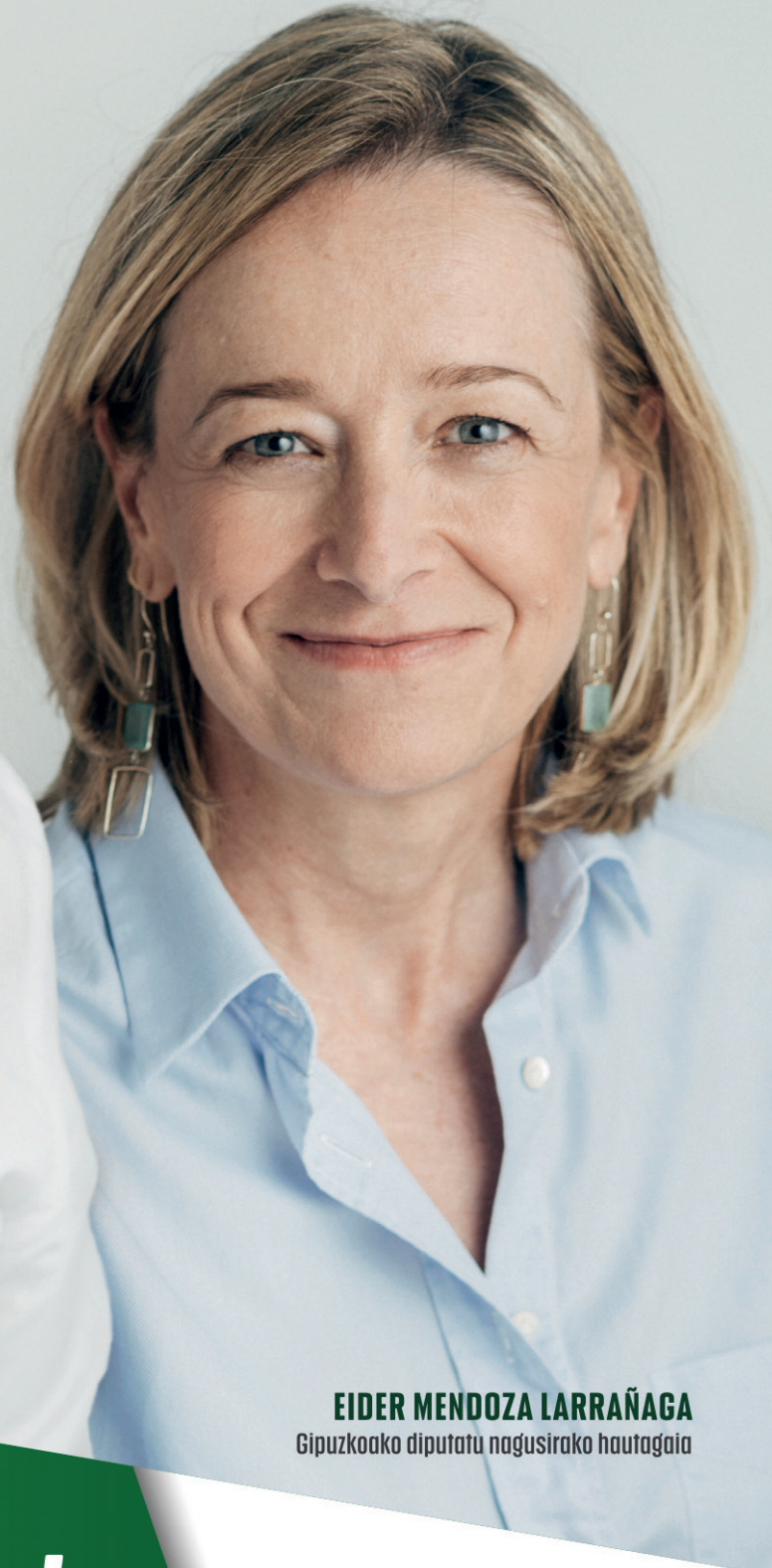
EIDER MENDOZA LARRAÑAGA

Gipuzkoako diputatu nagusirako hautagaia