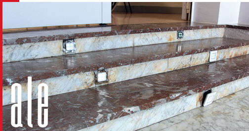
Kultur Etxeko sarrerako eskaileretako argitxoak puskatuta eta arriskutsu daude