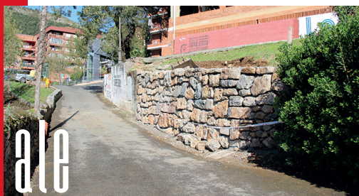
Harrizko lubeta berria egin dute Zubimusu etxe ondoan