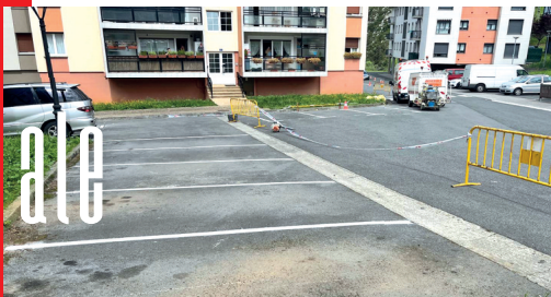
Arteaga auzoan aparkalekuak eta oinezkoen pasabideak margotu dituzte