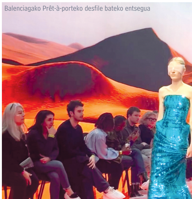
Balenciagako Prêt-à-porteko desfile bateko entsegua

Halako xehetasunak antzematen ikasi dut: barrena zuzen dagoen, piezak orekatuta dauden... baina beti ere modu xume batean.