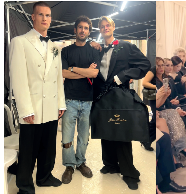
Balenciagaren 54. Kolekzioko backstagean bi modelokin

Urteak daramatzazu Europako hainbat hiriburutan bizitzen. Zestoan ez zenuen ikusten zure burua?