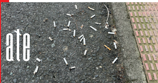
Zigarro-punta ugari lurretik