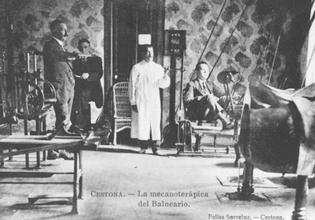
CESTONA. — La mecanoterápica del Balneario.