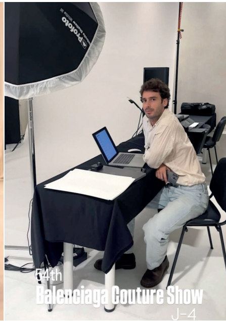
Balenciagaren goi joskintzako desfilea baino lau egun lehenago prestaketa lanetan