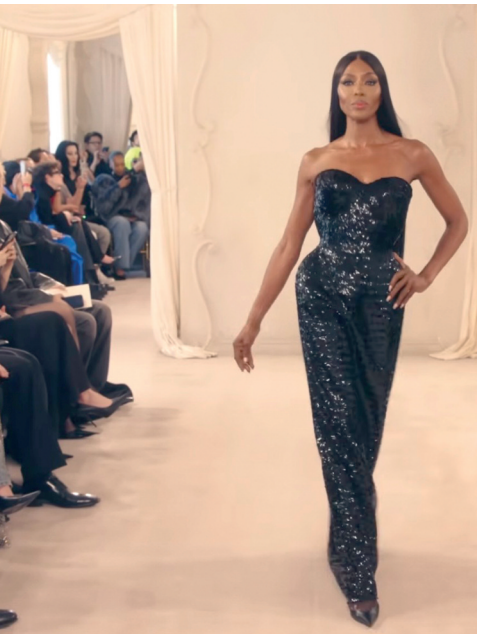
Naomi Campbell desfilatzen; Markeli besotik heldu zion egunean